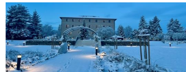
Zimní zámecká zahrada